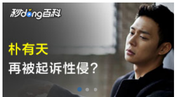
朴有天 再被起诉性侵？