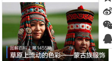
图解百科 | 第1455期 草原上流动的色彩——蒙古族服饰